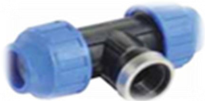
PPK T-stykke rør / innv. gjenger / rør