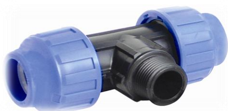
PPK T-stykke rør / utv.gjenger / rør