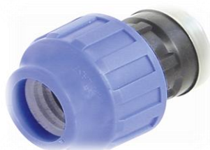
PPK Adapter for rør / innv. gjenger