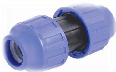
PPK Union rør / rør