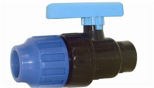
PPK Ventil rør / innv. gjenger