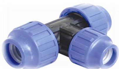
PPK T-stykke rør / rør-reduksjon / rør