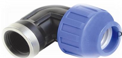
PPK Albue 90 gr. bend for rør / innv. gjenger