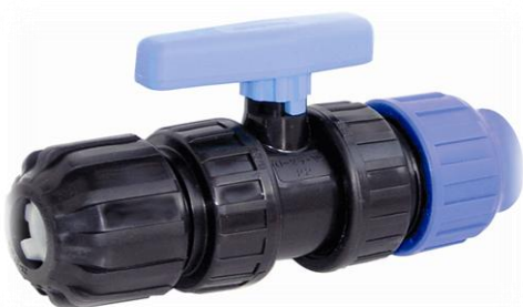
PPK Ventil Union rør / rør