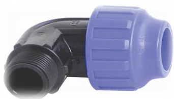
PPK Albue 90 gr. bend for rør / utv. gjenger