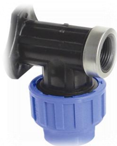
PPK Veggmontert adapter rør / innv. gjenger