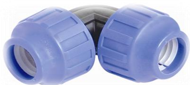
PPK Union 90 gr. bend for rør/rør.

Prisliste for STP kompresjonsfittings PPK. For vann PN25, for gass PN16.