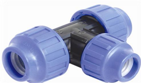
PPK T-stykke rør/rør/rør