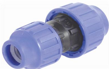
PPK Union rør / rør reduksjon