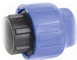
PPK Endehetter mot rør