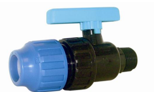
K Ventil rør / utv. gjenger