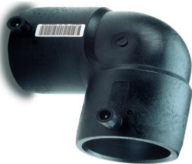
EFK 90 gr. bend sveisekupling rør / rør