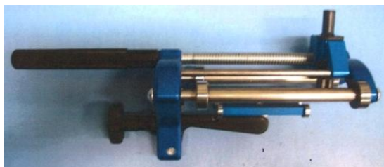
Det perfekte og lettvinde skrellevertøy.