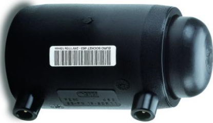
EFK Endehette sveisekupling rør