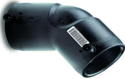
EFK 45 gr. bend sveisekupling rør / rør