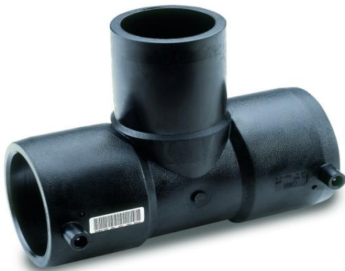
EFK T-stykke sveisekupling rør / rørende / rør